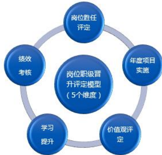
岗位职级晋升评定（每年 1—2 次）